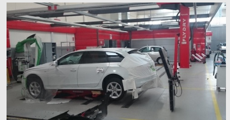
Tack vare finansiering vid starten kunde Modena Car Service investera i den senaste tekniken och i högkvalitativa material.