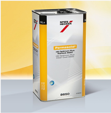
Permasolid® Verniz HS Optimum Plus 8650