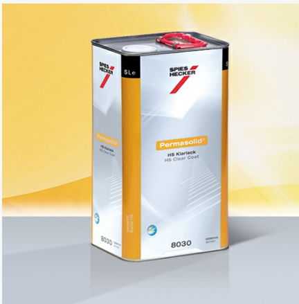
Permasolid® Verniz HS 8030