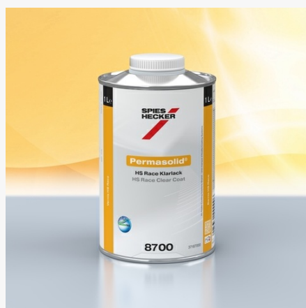
Permasolid® HS Race Clear Coat 8700