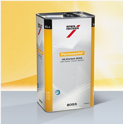
Permasolid® Verniz HS 8055