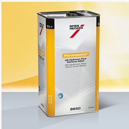
Permasolid® HS Optimum Plus Klarlack 8650