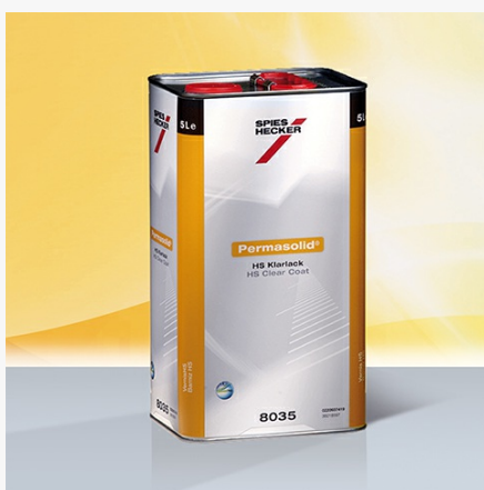
Permasolid® HS Klarlack 8034