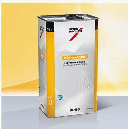
Permasolid® HS Klarlack 8055