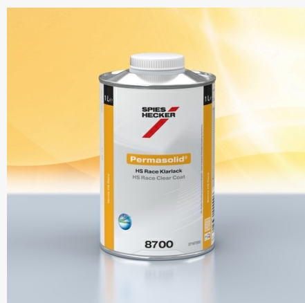
Permasolid® HS Race Clear Coat 8700