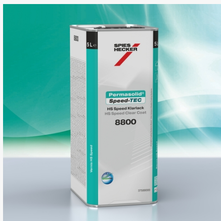
Permasolid® HS Speed Klarlack 8800