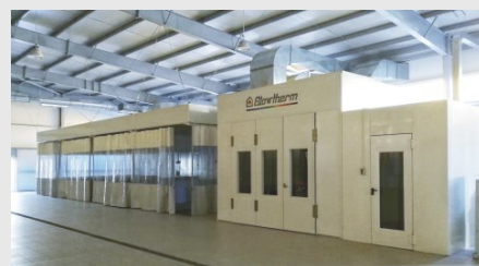
Nowoczesne kabiny lakiernicze to nieodłączny element wyposażenia nowego centrum Toyoty.