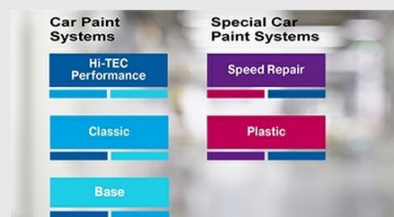
Właściwy system produktów Spies Hecker dla każdego warsztatu i zastosowania.

System Classic to połączenie niezwykle łatwej aplikacji, niezawodnych rezultatów i wysokiej jakości. W skład systemu Classic wchodzi takie produkty jak Permahyd Basecoat 280/285, Vario Primer Surfacer 5340, Premium Surfacer 5310 oraz nowy Race Clearcoat 8700 (oferowane są również inne produkty). Prawie wszystkie produkty posiadają certyfikat przydatności do seryjnego lakierowania samochodów. Oferujemy również stosowne narzędzia kolorystyczne: w systemie Hi-TEC Performance jest to spektrofotometr ColorDialog Phoenix (połączony z oprogramowaniem Phoenix). Program jest połączony ze specjalnymi wagami oraz drukarkami etykiet.