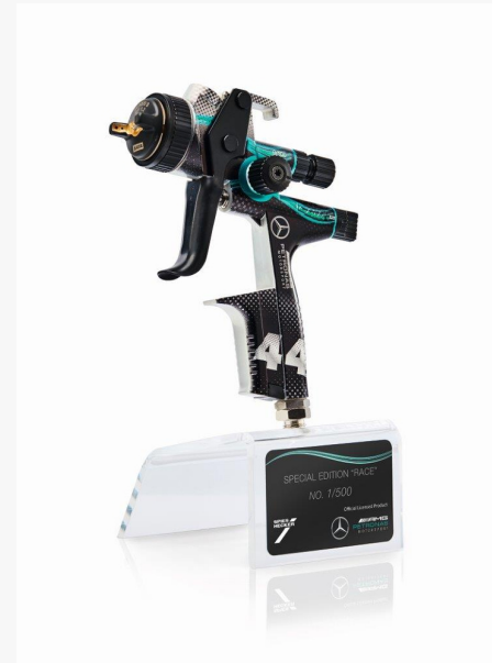
Mit der „Race-Gun“ präsentiert Spies Hecker eine streng limitierte Lackierpistole im rasanten Design des fünffachen Formel1-Weltmeisterteams Mercedes-AMG Petronas Motorsport.