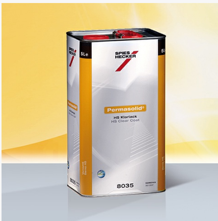
Permasolid® HS Klarlack 8034