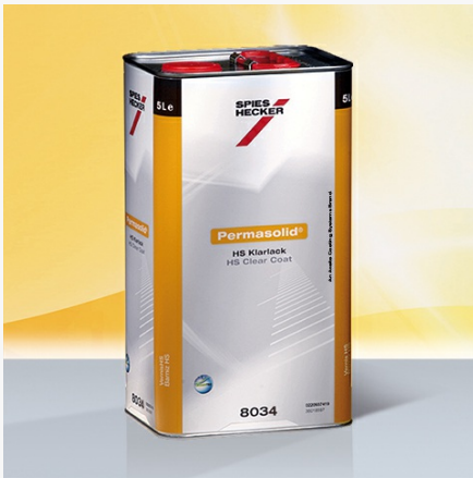
Permasolid® HS Clear Coat 8034