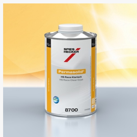
Permasolid® HS Race Clear Coat 8700