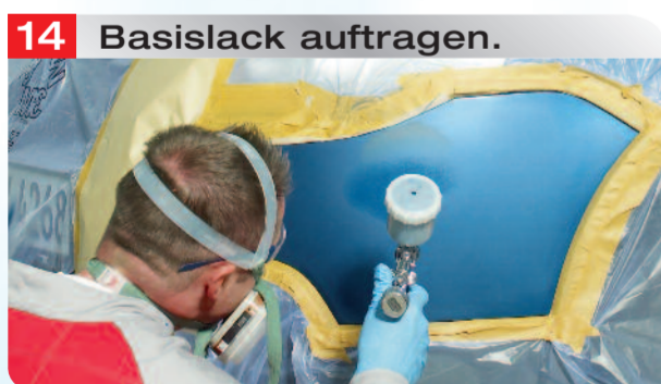
14 Basislack auftragen.

Vor Auftrag von Permahyd® Hi-TEC 480 die Schadstelle mit Spies Hecker Staubbindetuch nochmals reinigen.