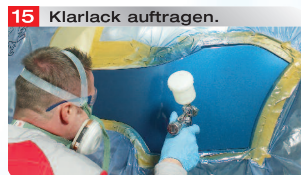
15 Klarlack auftragen.

Auftrag von Permahyd® Hi-TEC 480 in 3–5 dünnen und in sich jeweils überlappenden Spritzgängen.