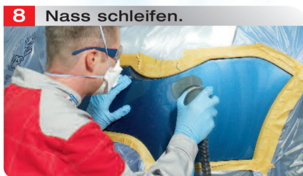
8 Nass schleifen.

Ausschleifen der Schadstelle mit Excenter-schleifer P400.