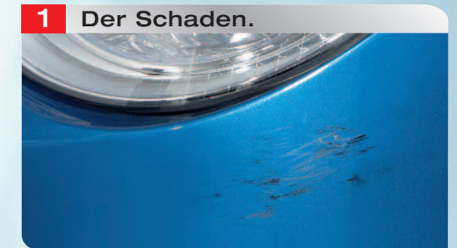
1 Der Schaden.