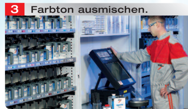
3 Farbton ausmischen.

Ausmischen des Farbtons mit CRplus, dem Spies Hecker Farbtionsuchprogramm.