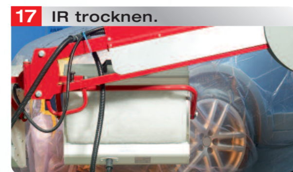
17 IR trocknen.

Permacron® Speed Blender 1036 pur auf den Beilackierbereich innerhalb der geschliffenen Fläche applizieren.