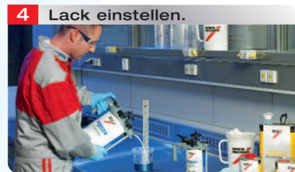
4 Lack einstellen.

Ausmischen des Farbtons mit CRplus, dem Spies Hecker Farbtionsuchprogramm.