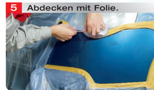
5 Abdecken mit Folie.

Permahyd® Hi-TEC 480 mit Permahyd® Beispritz Additiv 1050 1:1 + 10 % Permahyd® Flop Control WT 386 einstellen.