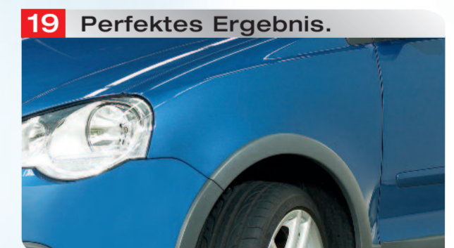
19 Perfektes Ergebnis.